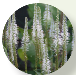
Raíz de Culver Veronicastrum virginicum