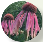
Equinácea morada pálida Echinacea pallida