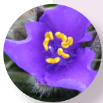
Lirio araña Tradescantia tharpaii