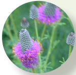
Dalea morada Dalea purpurea