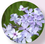
Phlox azul Phlox divaricata