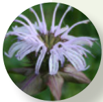
Bálamo de abeja gitana de la pradera* Monarda bradburiana "Gitana de la pradera"