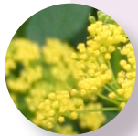
Alexander de oro Zizia aurea