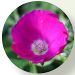
Malva amapola morada Callirhoe involucrata