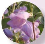
Lengua de barba grande Penstemon grandiflorus