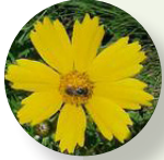
Coreopsis hoja de lanza Coreopsis lanceolata