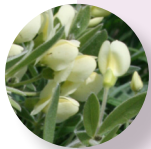
Índigo silvestre blanca Baptisia lactea